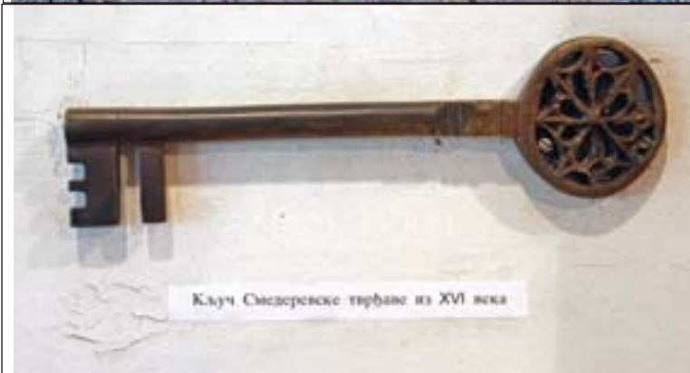
Кључ Смедеревске тврђаве из XVI века

тара. Због величине простора на којем се простире, Смедеревска тврђава се сматра једном од највећих средњовековних тврђава равничарског типа, не само код нас већ у целој Европи.